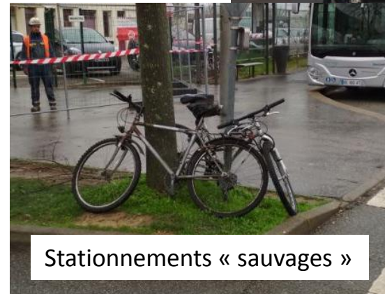
Stationnements « sauvages »